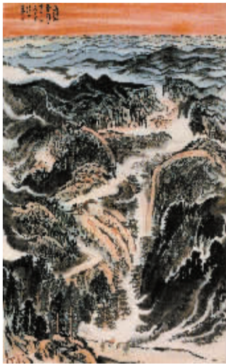
疑似伪作 陆俨少(款)《高路入云端》 曾以99.68万元成交

殊不知《拍卖法》的“总则”中多有保护自己合法权益的条款,如“第四条,拍卖活动应当遵守有关法律、行政法规,遵循公开、公平、公正、诚实信用的原则”中所谓的“有关法律、行政法规”,是因为我国现行法律法规之间虽是独立成章,但在执行时,任何一部法律都是有“本法未作规定的,受其他有关法律、法规保护”的声明。如《拍卖法》第五章·法